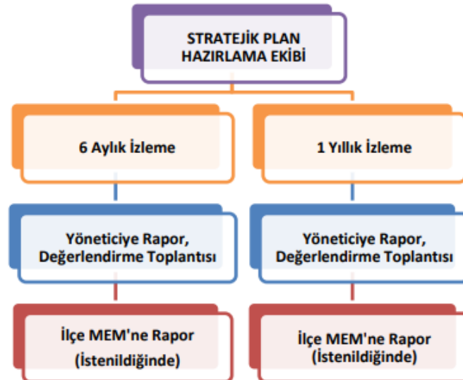
Tablo 35. İzleme ve Değerlendirme Tablosu

Müdürlüğümüzün 2024-2028 Stratejik Planı İzleme ve Değerlendirme sürecini ifade eden İzleme ve Değerlendirme Modeli hazırlanmıştır. Okulumuzun Stratejik Plan İzleme-Değerlendirme çalışmaları eğitim-öğretim yılı çalışma takvimi de dikkate alınarak 6 aylık ve 1 yıllık sürelerde gerçekleştirilecektir. 6 aylık sürelerde Okul Müdürüne rapor hazırlanacak ve değerlendirme toplantısı düzenlenecektir. İzleme-değerlendirme raporu, istenildiğinde İlçe Milli Eğitim Müdürlüğüne gönderilecektir.